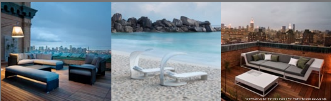
Handwoven Outdoor Furniture created with weather resistant DEDON fibre.

DEDON دارای هر آن چیزی است که شما برای برخورداری از سبک یک زندگی با آسایش و شوق انگیز در فضای داخلی و فضای بیرونی منزل به آن احتیاج دارید. در جام جهانی فوتبال و مسابقات جام ملت‌های اروپا DEDON تولید کننده رسمی مبلمان بیرونی محل اقامت تیم آلمان بود. همچنین این برند با مجموعه محصولات زیبای خود زینت بخش هفته مد مرسدس بنز در شهر برلین آلمان بود!